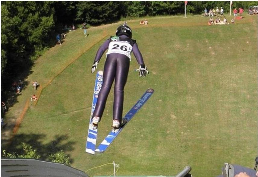
SKISPRINGEN AUF DER KREUZBERGSCHANZE

Leitung und Info: Maximilian Lange, Tel. 0173 / 88 30 15 5