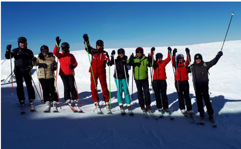
EINIGE TEILNEHMER DER SKIFREIZEIT 2019 IM ZILLERTAL

Mail: wsv-obrunninfo.mg@email.de Schulpfad 3, 97792 Riedenberg Tel.: 09749-248 oder 0173-655 3657 Fax: 09749-931 173