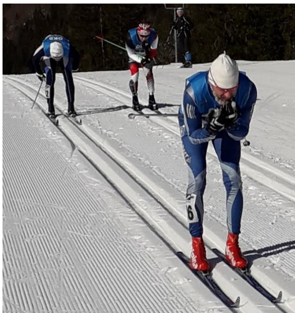
DEUSCHE SENIOREN MEISTERSCHAFT 2019 IN RUHPOLDING

Die Vereinsmeisterschaft Alpin ist am 19. Januar 2020, sowie die Vereinsmeisterschaft im Langlauf am 26. Januar 2020 geplant. Es ist geplant in beiden Veranstaltungen Nordisch und Alpin, gemeinsam mit dem RWV Haselbach die jeweiligen Vereinsmeister zu ermitteln.