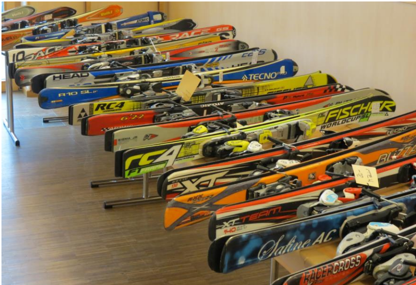
WINTERSPORTARTIKEL ANGEBOT BEIM SKIBASAR

Anlieferung der Artikel: Sa 09. November 17:00-18:00 Uhr Abholung: So 10. November 11:30-12:00Uhr