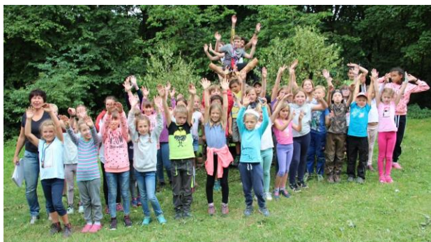
ZELTLAGER 2019 – HELLE BEGEISTERUNG!