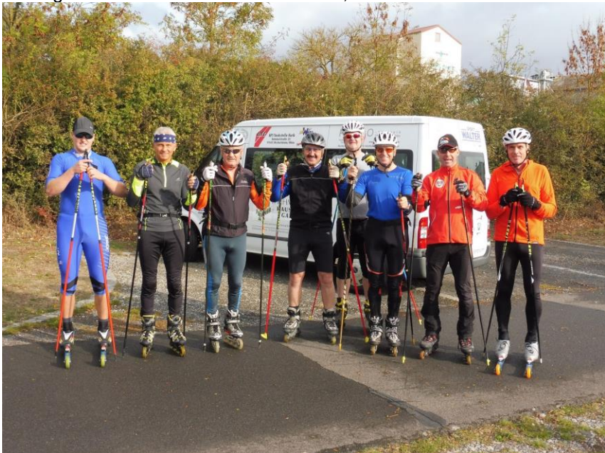
INLINER UND ROLLSKI MARATHON AM 3. OKTOBER VON BAD KÖNIGSHOFEN NACH OBERWEISSENBRUNN